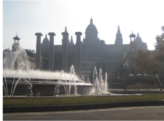
τα γνωστά συντριβάνια!

Σε όλα αυτά, πολύτιμος οδηγός, ξεναγός και μεταφραστής, ο Λάζαρος έντυνε με τις γνώσεις και τις πληροφορίες του όλες αυτές τις μοναδικές εμπειρίες.