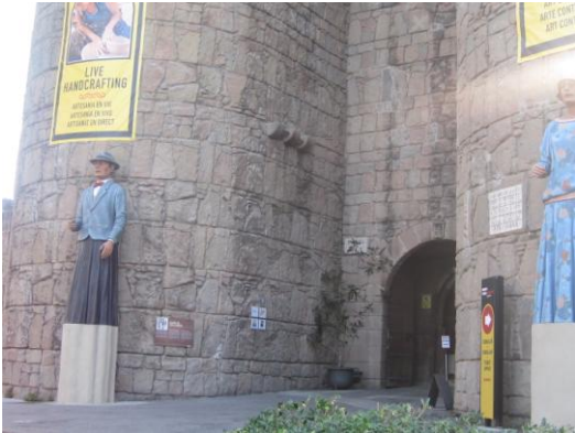
Το "Ισπανικό χωριό"

Η τελευταία μέρα αφιερωμένη σε μια καταπληκτική ξενάγηση, ξεκίνησε νωρίς με βόλτες στην πόλη. Περιήγηση στο Ολυμπιακό Χωριό, αποτέλεσμα των Ολυμπιακών Αγώνων του 1992, βόλτα στο "Ισπανικό Χωριό", για να δούμε πώς κατασκευάζονταν οι εντυπωσιακές κατοικίες των Ισπανών πριν χρόνια, ο λόφος από τον οποίο μπορεί κανείς να θαυμάσει την πανοραμική θέα της πόλης, η μικρή Μπαρτσελόνα ή αλλιώς Barceloneta, με την μεγάλη αμμουδιά και τα αμέτρητα νυχτερινά clubs που προσφέρουν διασκέδαση σε ντόπιους και τουρίστες.